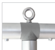
Points d'accroche en métal