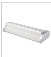
Extrémités de carter anodisées grises