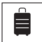
Sac de transport inclus

La colonne est constituée d'une structure en PVC gonflable habillée par une toile imprimée en sublimation numérique allover. L'ensemble est lié à un socle lestable pour une utilisation en intérieur et en extérieur. La colonne se gonfle par une valve en 50 secondes. Au centre du tube, un fourreau permet d'insérer un bandeau de LED pour en faire une colonne lumineuse. Le produit est livré entièrement assemblé : il ne reste plus qu'à gonfler la colonne. Cette colonne ne nécessite pas d'alimentation électrique continue. Peu encombrant et léger, ce produit est facilement transportable dans son sac (en option). Gonfleur électrique 150 W ou pompe manuelle en option.