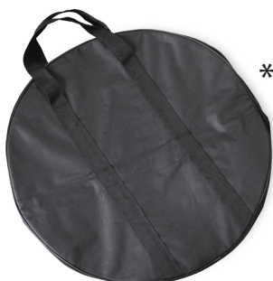
Sac de transport UNIQUEMENT SUR CAPTAIR 45