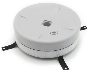
Bande Velcro® lestable Utilisation intérieure / extérieure.