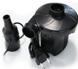
WA24 ⚡ 150 W / 220 V