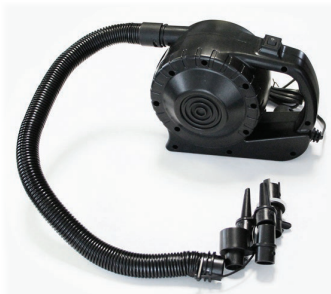
WA28 ⚡ 400 W / 220 V